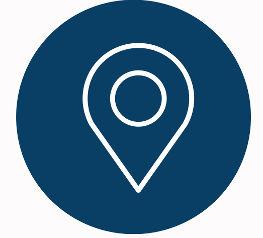
Dış Mekan Faaliyetleri